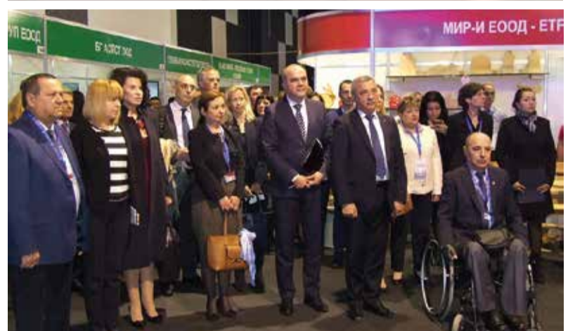
продукт – „Колекция работно | труд“ – София ЕООД. облекло“, бе връчен на „Тих | Вижте всичко – на стр. 2-3

* На 16 април тази година се откри Седмият европейски форум на социалното предприемачество. Тази година форумът се проведе в София и бе официално събитие в рамките на Българското председателство на съвета на ЕС.