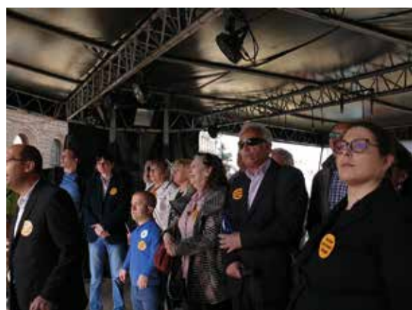
На стр. 4, 5 и 6 четете подробния репортаж на Петра Ганчева за всичко, което се случило на събитието

А те, нашите искания, са простички и ясни: НЕ ПО ТОЗИ НАЧИН! НЕ ПОСЯГАЙТЕ НА МАЛКОТО, КОЕТО ИМАМЕ! ПОСТАВЕТЕ СЕ НА НАШЕТО МЯСТО, ОПИТАЙТЕ СЕ ДА ЖИВЕЕТЕ С МИЗЕРНА ПЕНСИЯ И БЕЗ ВЪЗМОЖНОСТ ЗА НИКАКВИ ДРУГИ ДОХОДИ ПОРАДИ УВРЕЖДАНЕТО – И ТОГАВА ЩЕ ВИДИТЕ ЗАЩО ПРОТЕСТИРАМЕ.